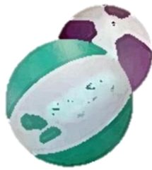
ビーチボール バレー1面